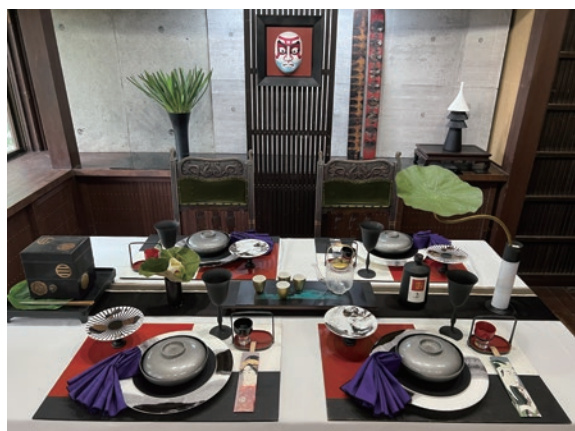
幕が上がる ～映画国宝の余韻をテーブルに～ 今村 直子