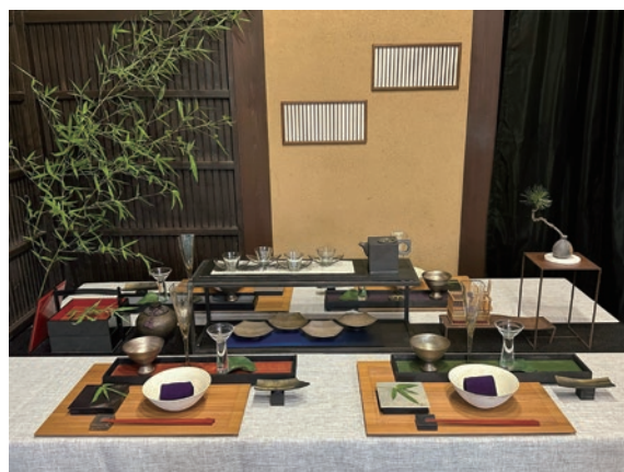
星涼し～短冊に願いを～ 砂田 紗希