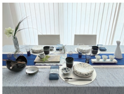
北斎ブルーに誓う六十路の宴 よしおか りえこ