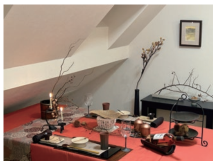
夜長の候～木曽路を愉しむ～ 宮本 由香